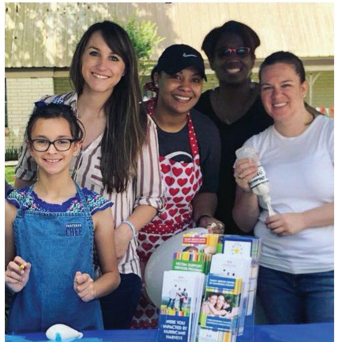
En entornos de escuelas y en ferias de recuperación comunitaria, el Centro de Servicios Familiares del Condado de Galveston que es beneficiario de la Cruz Roja Americana brinda servicios de salud mental y consejería a niños y familias que se recuperan del trauma del Huracán Harvey.